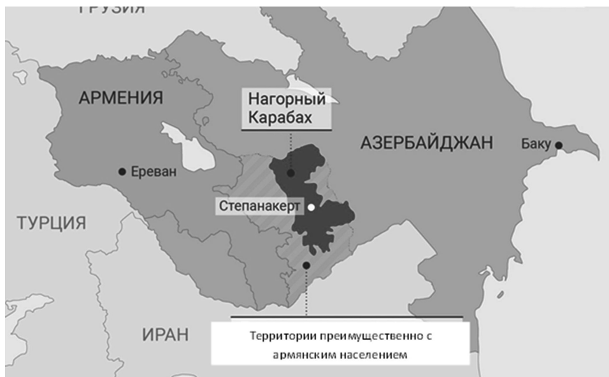
Рис. 1. Спорные территории в НКАО Азербайджана, (1991)

Рост национального самосознания малых народов привел к активным деструктивным процессам в республиках бывшего Советского Союза (Россия также была втянута в этот процесс). Титульные нации получили свою государственность и суверенитет, и стали неотступно реализовывать политику вытеснения малых народов со своих территорий, их исторической родины, что вызвало ответную реакцию со стороны национальных меньшинств. 20 февраля 1988 г. было положено начало активным протестам среди населения Нагорно-Карабахской Автономной области (НКАО) за отделение ряда районов от Баку (рис. 1).