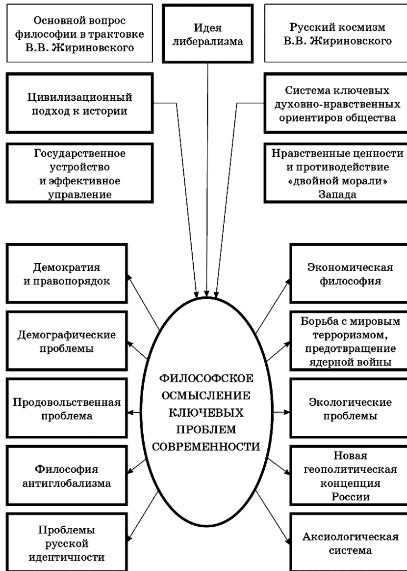
Рис. 1. Структура философского наследия В. В. Жириновского