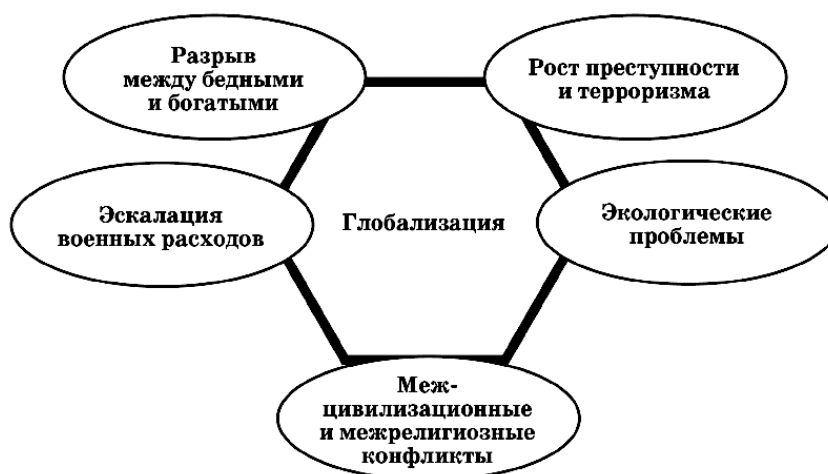
Рис. 2. Актуальные проблемы современности

Основные современные проблемы глобализации В. В. Жириновский делит на несколько групп (см. рис. 2).