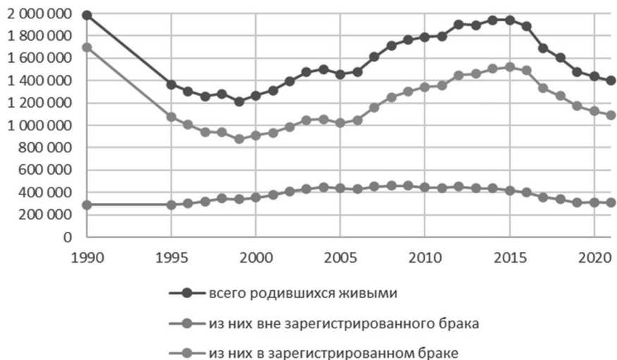
Рис. 1. Число брачных и внебрачных рождений в России 1990–2020 гг.

ненный» брак долгое время являлся одним из оплотов частной собственности 4 . В постиндустриальном обществе новая система социальных ценностей привела к тому, что брачное репродуктивное поведение перестало быть единственным образцом для женщин, которые получили возможность самостоятельно, «автономно» содержать не только себя, но и своих детей, сохраняя при этом социокультурные потребности и интересы.